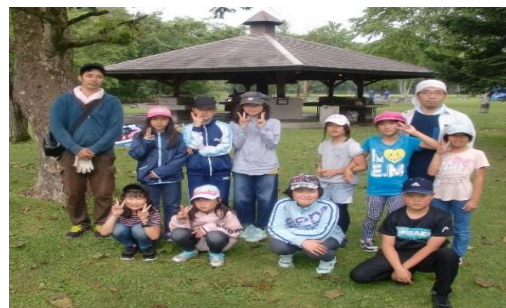
参加児童と「つみきの会」の方々

キャンプ場で、まき割をしたので、とてもすっきりしました。料理では、カレーライス、サンドイッチ、ポテトサラダがおいしかったです。キャンプでのテント建てや寝袋の挑戦は、初めてだったので大変でしたが、今回の体験で大きく成長したと思いました。キャンプファイヤーではジェンカをしたり、きもだめしでおどかしたりしました。デザートは、ブドウ、サクランボ、プラムを食べました。キャンプは、とても楽しかったです。本当にありがとうございました。